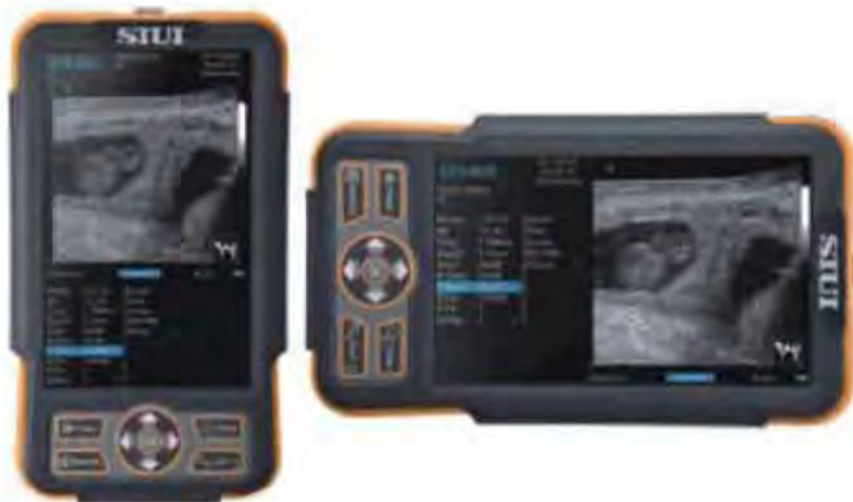
Автоматично завъртане на екрана

R20/5.0 MHz микро-конвексен трансдюсер - опция