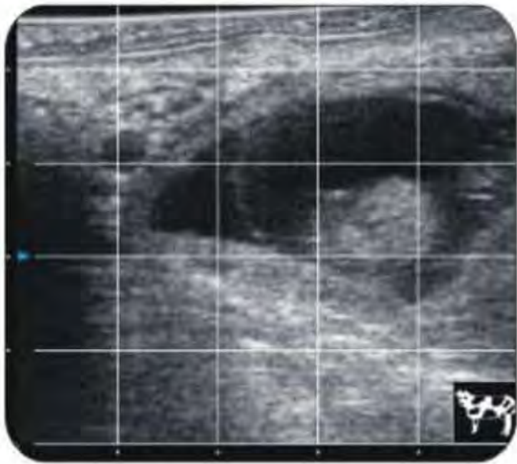
“Решетка” за бързо определяне на размери